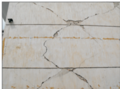
大田中学学生宿舍被地震拉裂