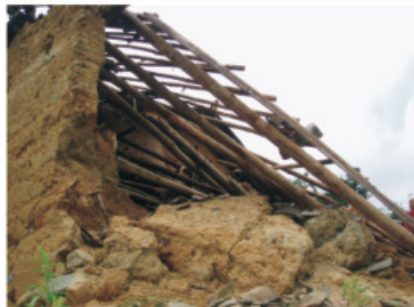
仁和区中坝乡垮塌的民房