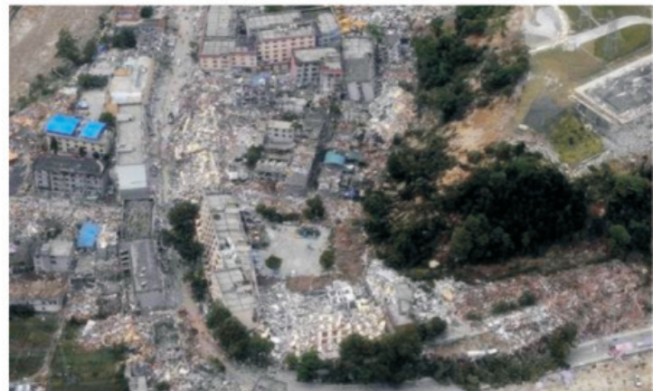
灾后满目疮痍的北川