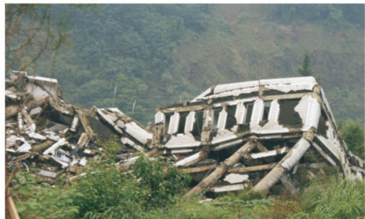
北川县城被破坏的房屋