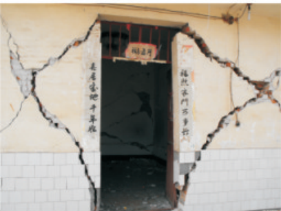
仁和区平地镇波西村受破坏的砖房