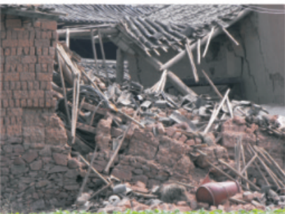
平地养路段破坏的民房