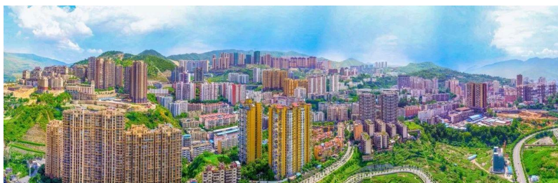
▲ 攀枝花城市新区一隅。

今年春节黄金周，攀枝花游客总量和旅游总收入继续大幅增长，据统计7天假期全市共接待游客174.5万人次，实现旅游总收入17.34亿元，与去年春节黄金周相比，分别增长10.49%和25.67%。