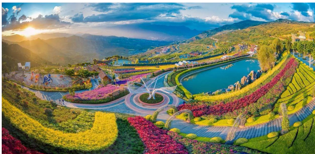
▲ 攀枝花市花舞人间。